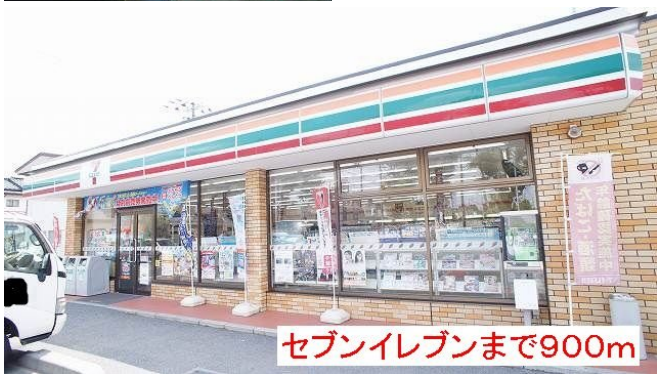
セブンイレブンまで900m