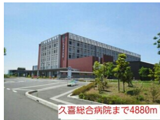
久喜総合病院まで4880m