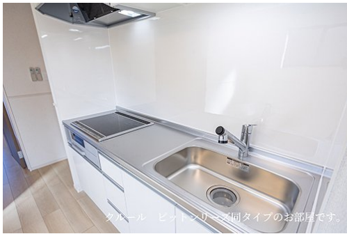
クルール ビットシリーズ同タイプのお部屋です。