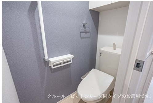
クルール ビットシリーズ同タイプのお部屋です。