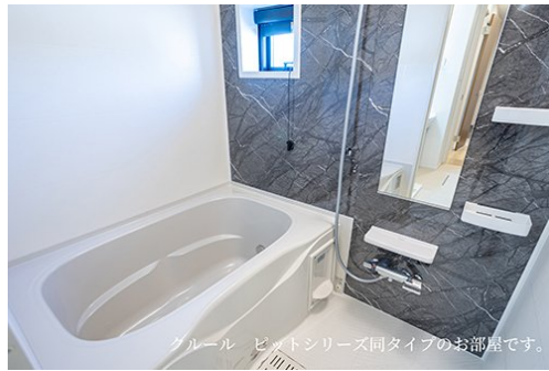
クルール ビットシリーズ同タイプのお部屋です。