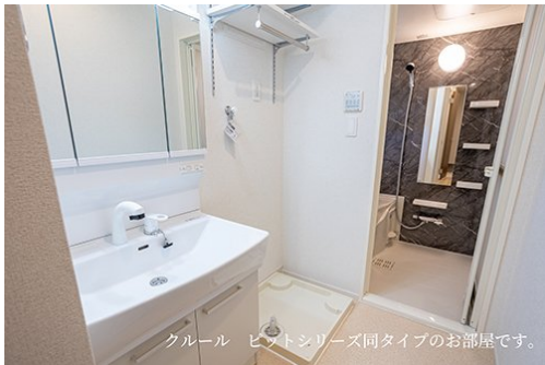
クルール ビットシリーズ同タイプのお部屋です。