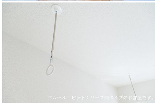
クルール ビットシリーズ同タイプのお部屋です。