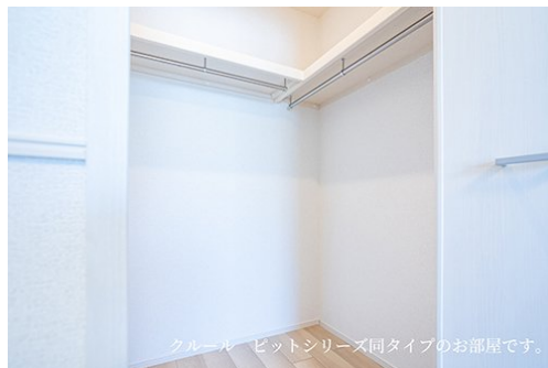
クルール ビットシリーズ同タイプのお部屋です。