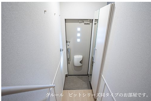
クルール ビットシリーズ同タイプのお部屋です。