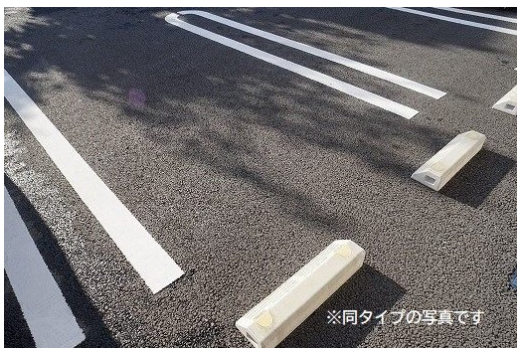
※同タイプの写真です