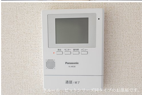
クルール ビットシリーズ同タイプのお部屋です。