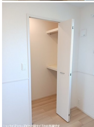
ニューライズシリーズK2Sと同タイプのお部屋です