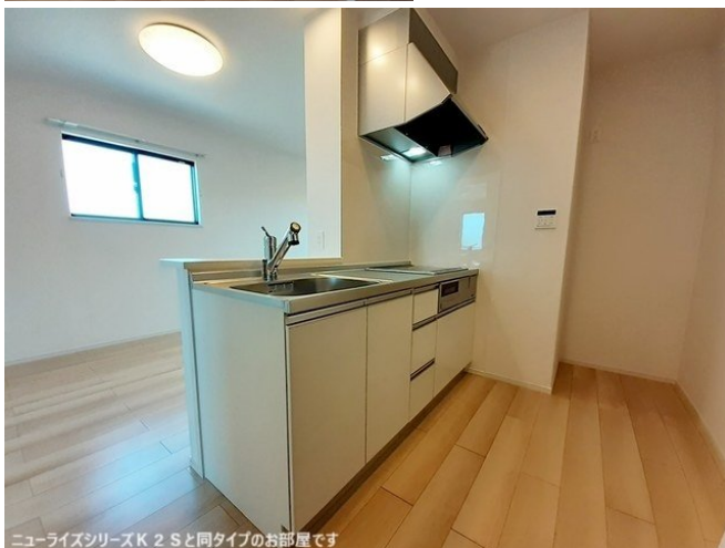
ニューライズシリーズK 2 Sと同タイプのお部屋です