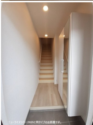
ニューライズシリーズK2Sと同タイプのお部屋です。