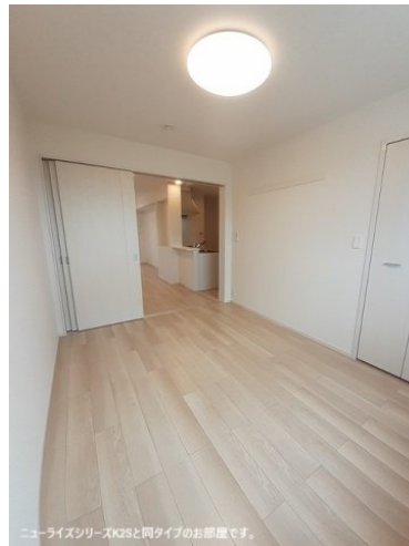
ニューライズシリーズK2Sと同タイプのお部屋です。