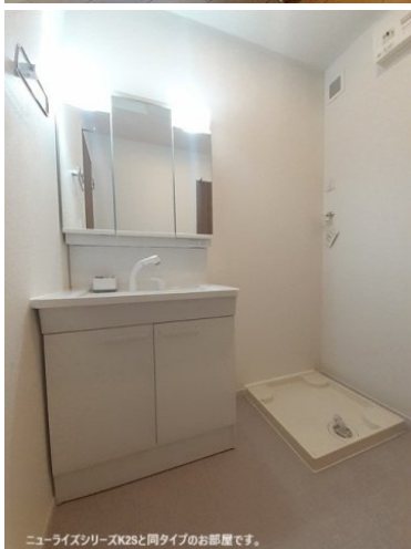
ニューライズシリーズK2Sと同タイプのお部屋です。