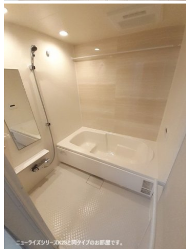
ニューライズシリーズK2Sと同タイプのお部屋です。