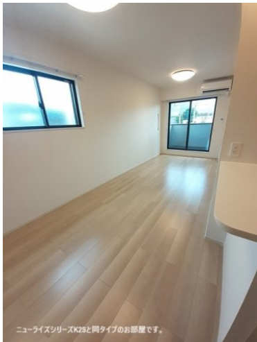
ニューライズシリーズK2Sと同タイプのお部屋です。