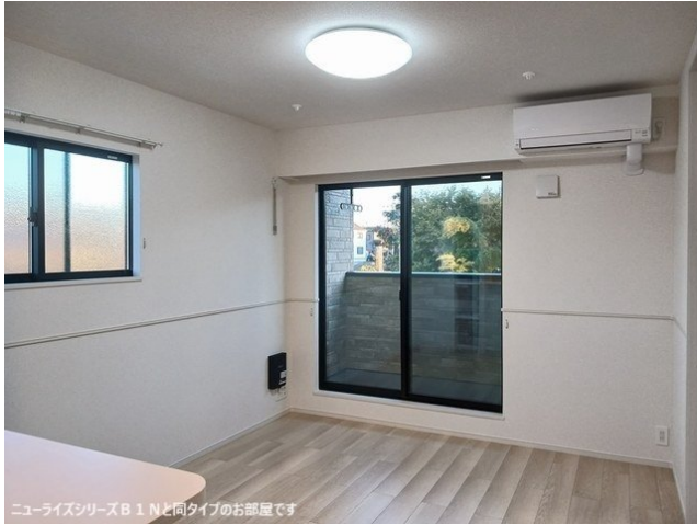
ニューライズシリーズB 1 Nと同タイプのお部屋です