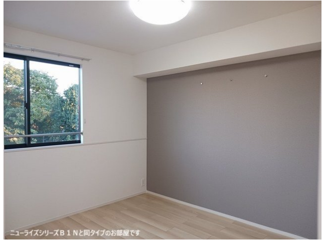
ニューライズシリーズB 1 Nと同タイプのお部屋です