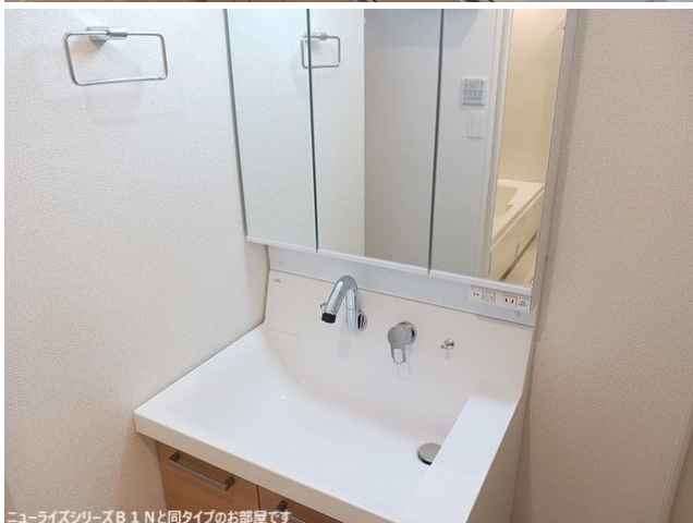
ニューライズシリーズB 1 Nと同タイプのお部屋です