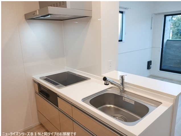
ニューライズシリーズB 1 Nと同タイプのお部屋です