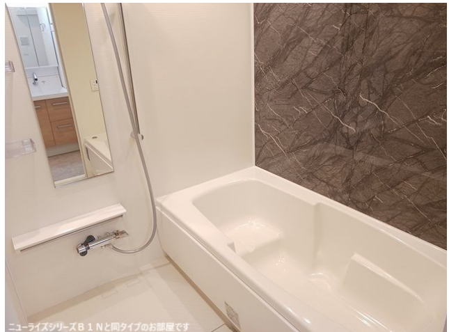
ニューライズシリーズB 1 Nと同タイプのお部屋です