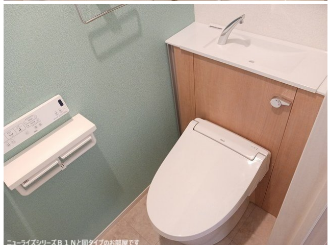
ニューライズシリーズB 1 Nと同タイプのお部屋です