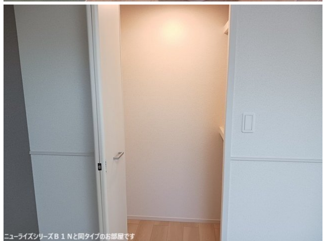
ニューライズシリーズB 1 Nと同タイプのお部屋です