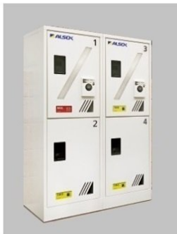
※ 完成設備と同設備になります