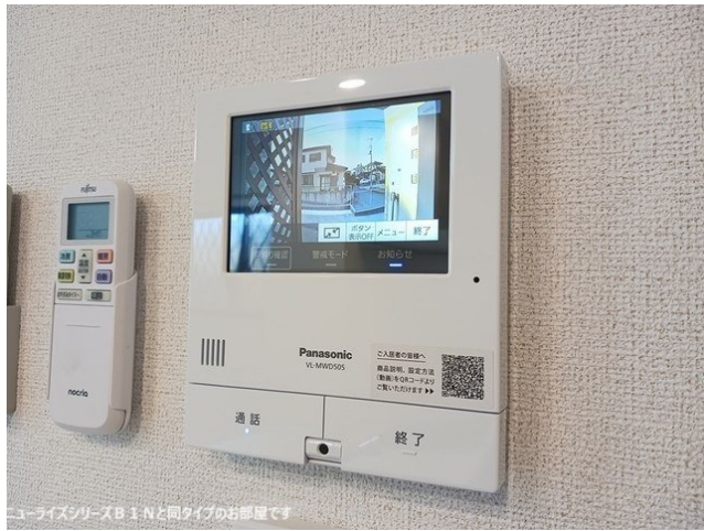
ニューライズシリーズB 1-Nと同タイプのお部屋です