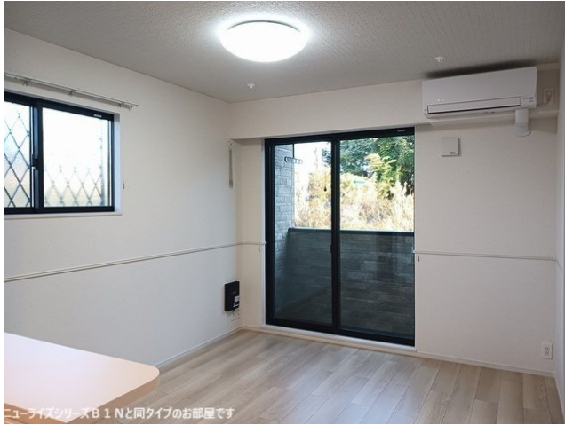
ニューライズシリーズB 1 Nと同タイプのお部屋です