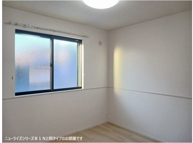
ニューライズシリーズB 1 Nと同タイプのお部屋です