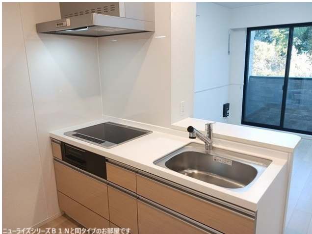
ニューライズシリーズB 1 Nと同タイプのお部屋です