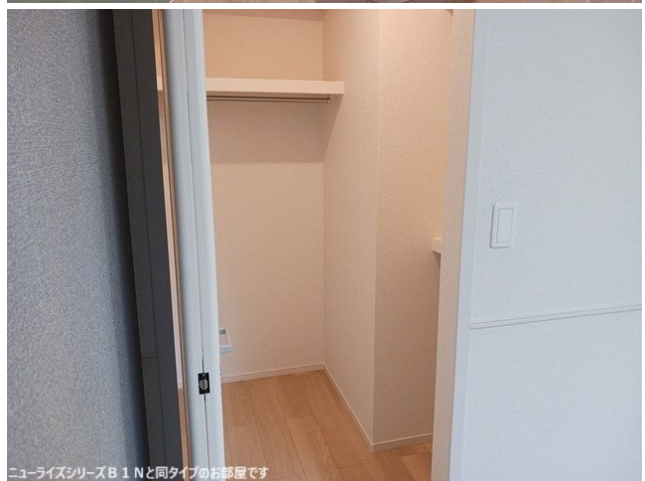
ニューライズシリーズB 1 Nと同タイプのお部屋です