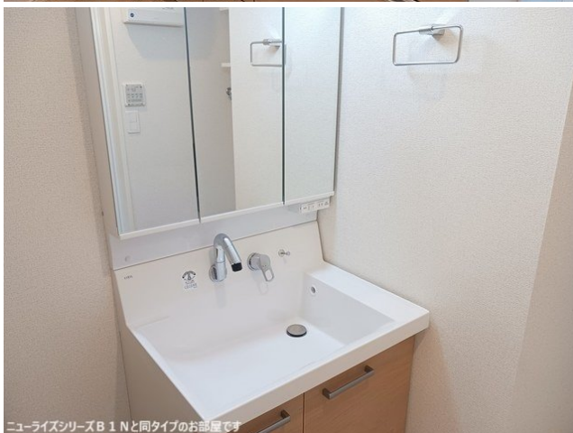
ニューライズシリーズB 1 Nと同タイプのお部屋です