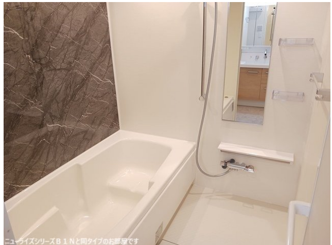
ニューライズシリーズB 1 Nと同タイプのお部屋です