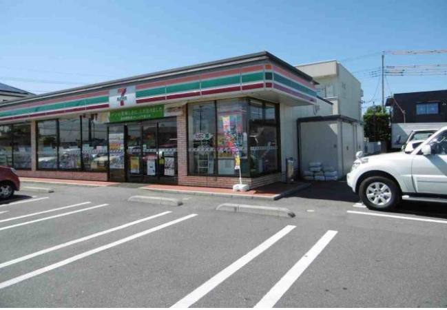
セブンイレブンまで 140.0m