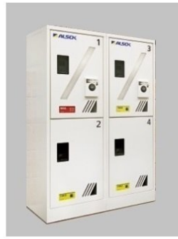
※ 完成設備と同設備になります