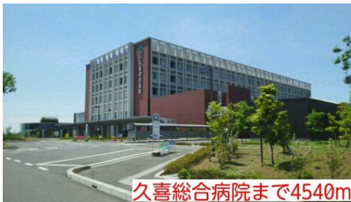
久喜総合病院まで4540m