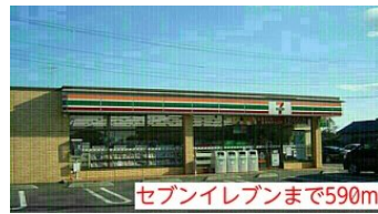
セブンイレブンまで590m