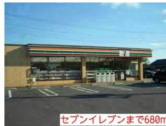
セブンイレブンまで680m