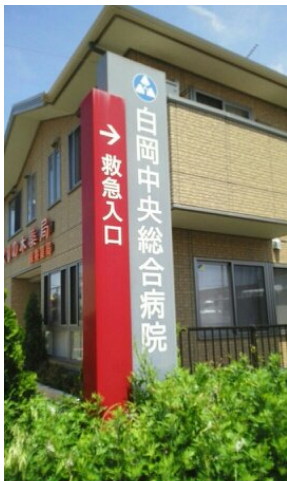
白岡中央病院まで2810m