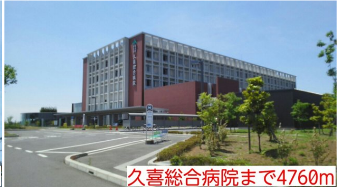
久喜総合病院まで4760m