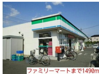
ファミリーマートまで1490m