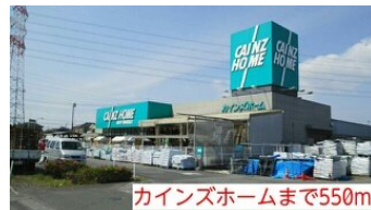
カインズホームまで550m