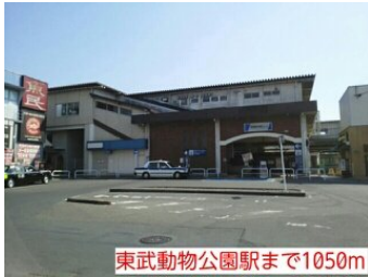
東武動物公園駅まで1050m