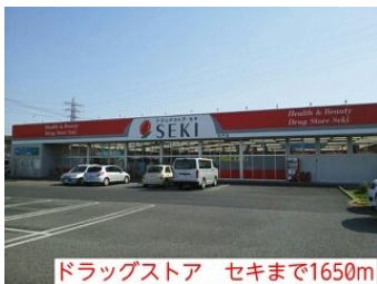
ドラッグストア セキまで1650m