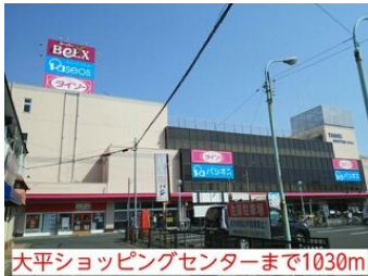
大平ショッピングセンターまで1030m