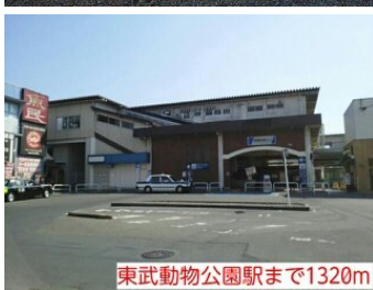
東武動物公園駅まで1320m