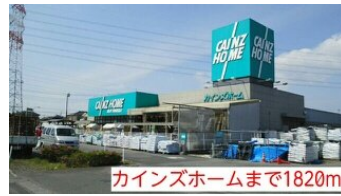
カインズホームまで1820m