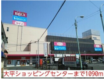
大平ショッピングセンターまで1090m