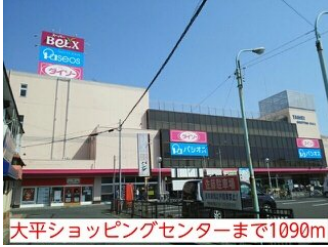
大平ショッピングセンターまで1090m