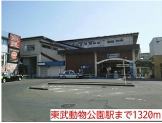
東武動物公園駅まで1320m