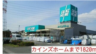
カインズホームまで1820m