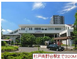
杉戸高野台駅まで320M