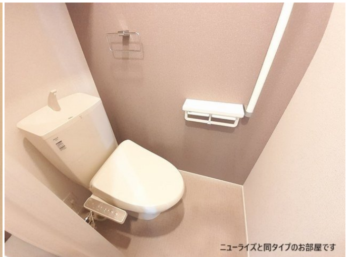
ニューライズと同タイプのお部屋です