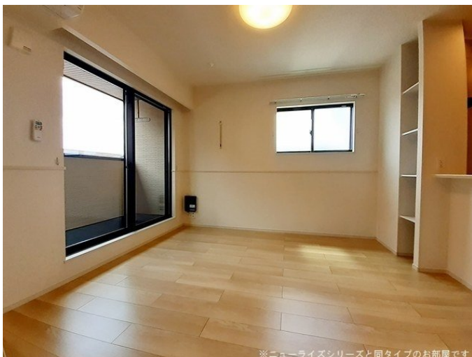
※ニューライズシリーズと同タイプのお部屋です