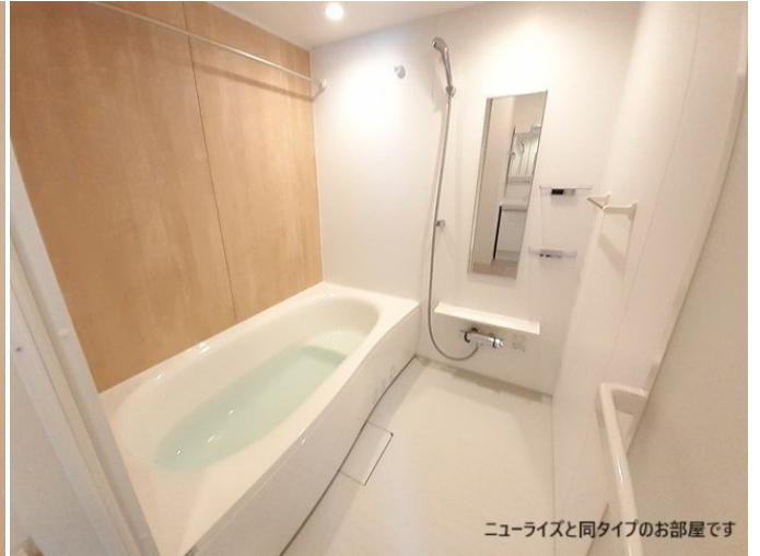
ニューライズと同タイプのお部屋です