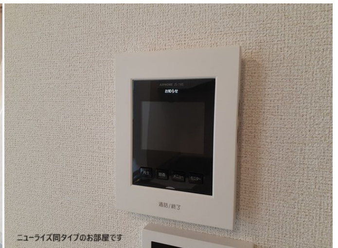
ニューライズ同タイプのお部屋です