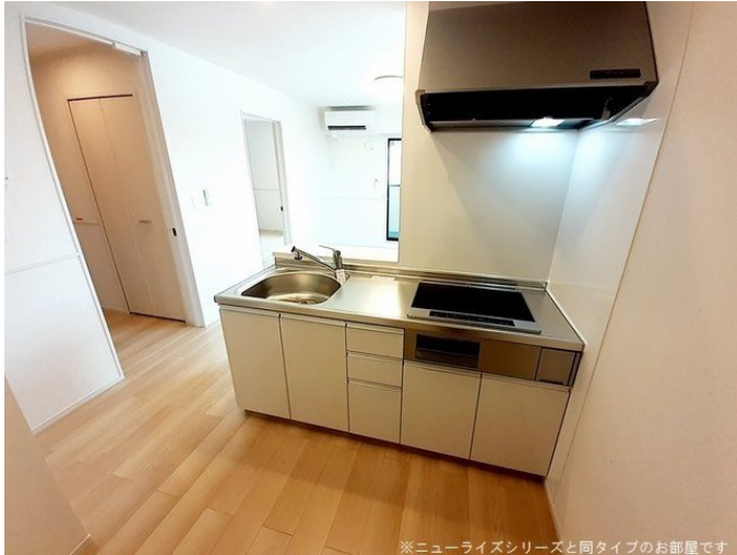
※ニューライズシリーズと同タイプのお部屋です