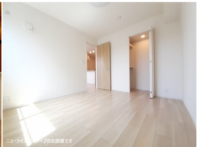
ニューライズシリーズのお部屋です