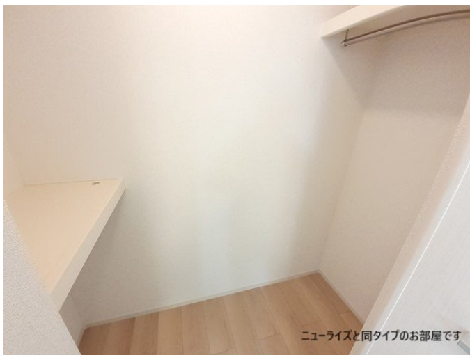
ニューライズと同タイプのお部屋です