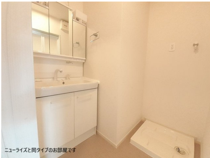
ニューライズと同タイプのお部屋です