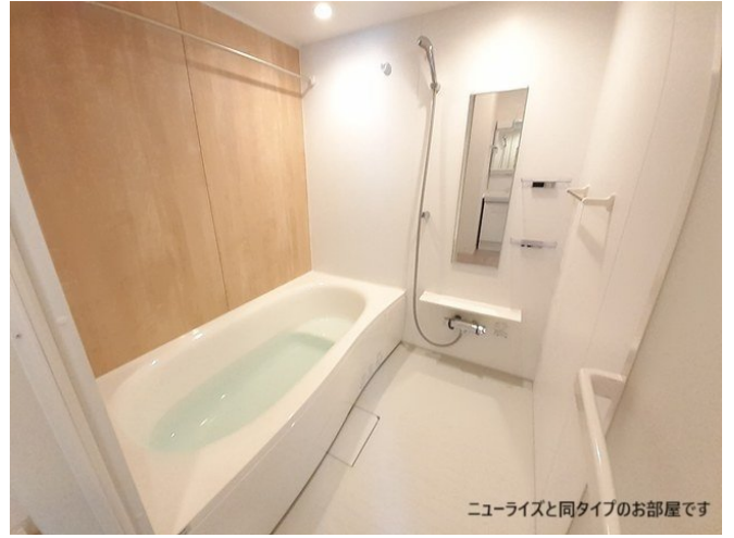
ニューライズと同タイプのお部屋です