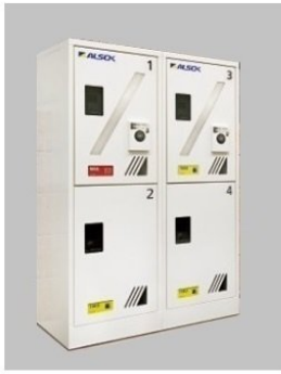
※ 完成設備と同設備になります