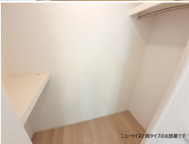
ニューライズと同タイプのお部屋です