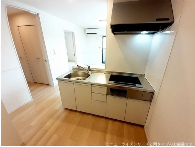
※ニューライズシリーズと同タイプのお部屋です