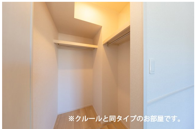
※クルールと同タイプのお部屋です。