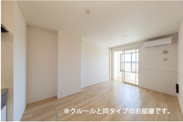
※クルールと同タイプのお部屋です。