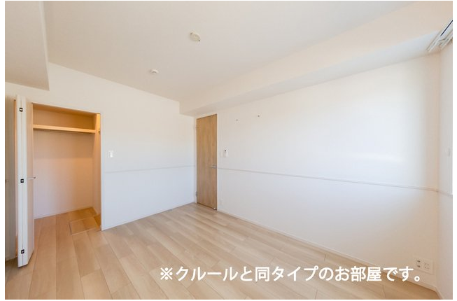
※クルールと同タイプのお部屋です。