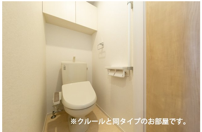
※クルールと同タイプのお部屋です。