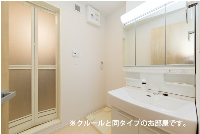
※クルールと同タイプのお部屋です。