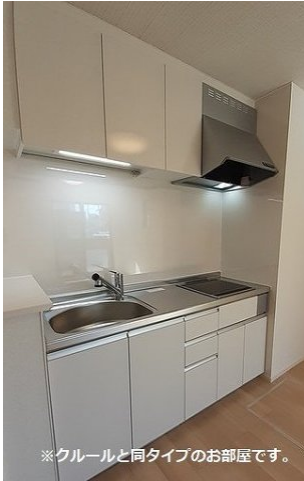
※クルールと同タイプのお部屋です。