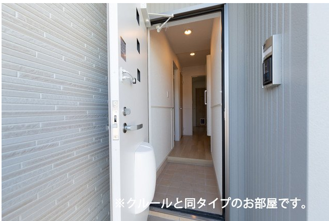
※クルールと同タイプのお部屋です。