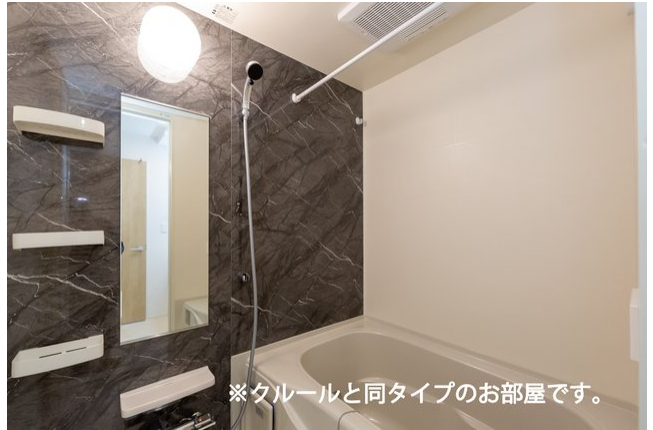
※クルールと同タイプのお部屋です。