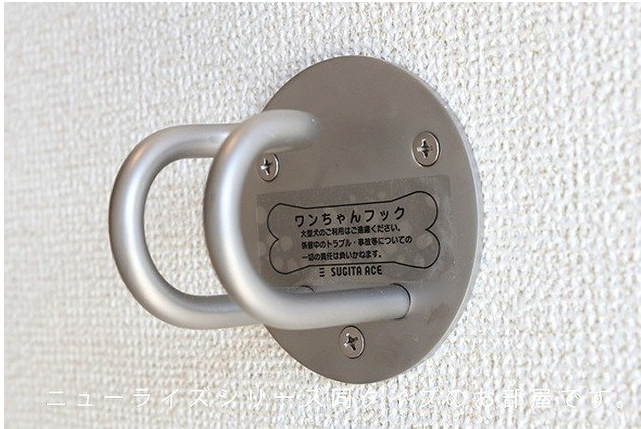
ニューライズシリーズと同タイプのお部屋です。