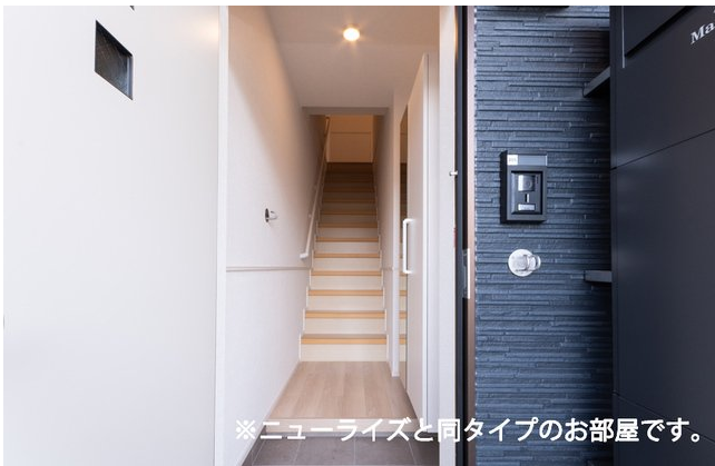
※ニューライズと同タイプのお部屋です。