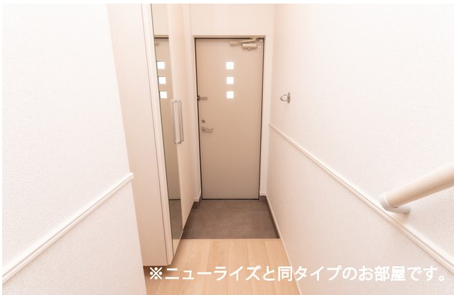
※ニューライズと同タイプのお部屋です。