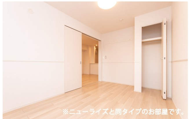
※ニューライズと同タイプのお部屋です。