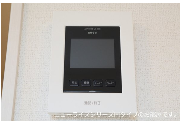
ニューライズシリーズ同タイプのお部屋です。