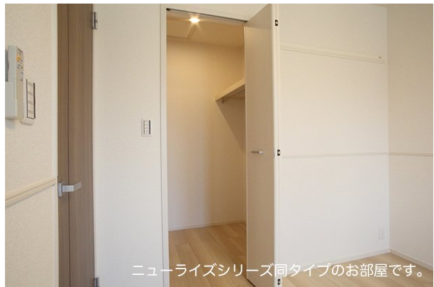
ニューライズシリーズ同タイプのお部屋です。