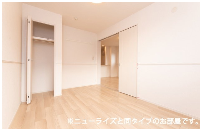
※ニューライズと同タイプのお部屋です。