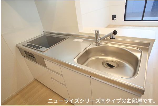
ニューライズシリーズ同タイプのお部屋です。