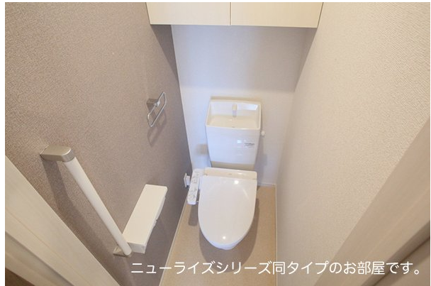
ニューライズシリーズ同タイプのお部屋です。