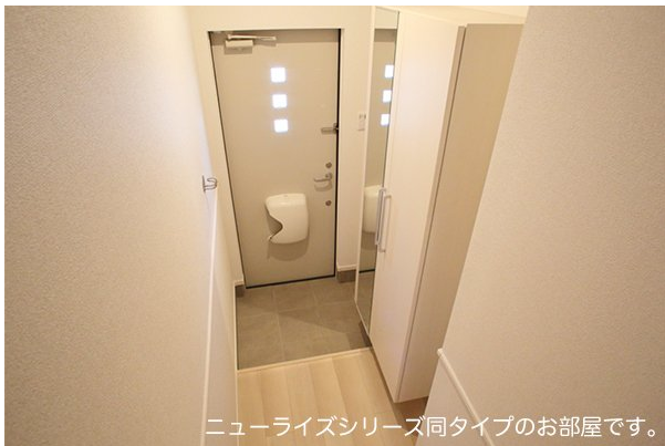
ニューライズシリーズ同タイプのお部屋です。