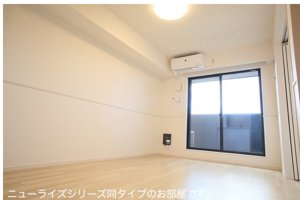
ニューライズシリーズ同タイプのお部屋です。