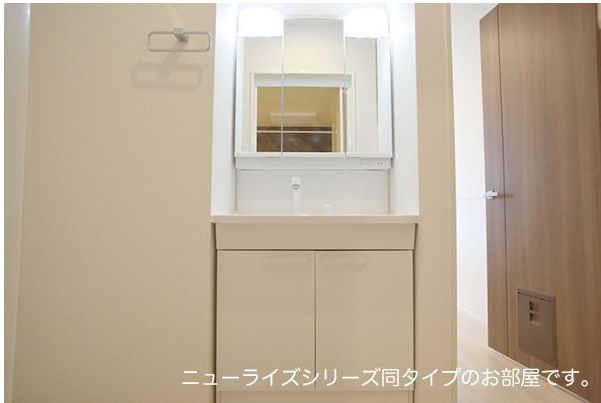
ニューライズシリーズ同タイプのお部屋です。