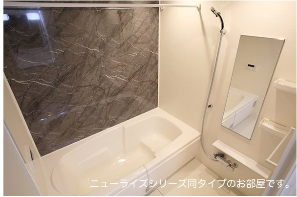
ニューライズシリーズ同タイプのお部屋です。