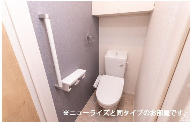
※ニューライズと同タイプのお部屋です。