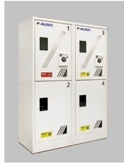
※ 完成設備と同設備になります