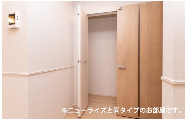
※ニューライズと同タイプのお部屋です。