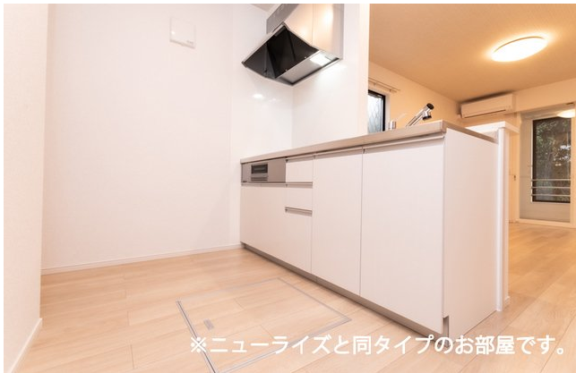
※ニューライズと同タイプのお部屋です。