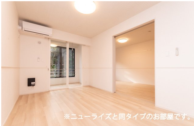
※ニューライズと同タイプのお部屋です。