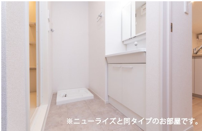
※ニューライズと同タイプのお部屋です。