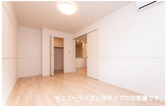
※ニューライズと同タイプのお部屋です。