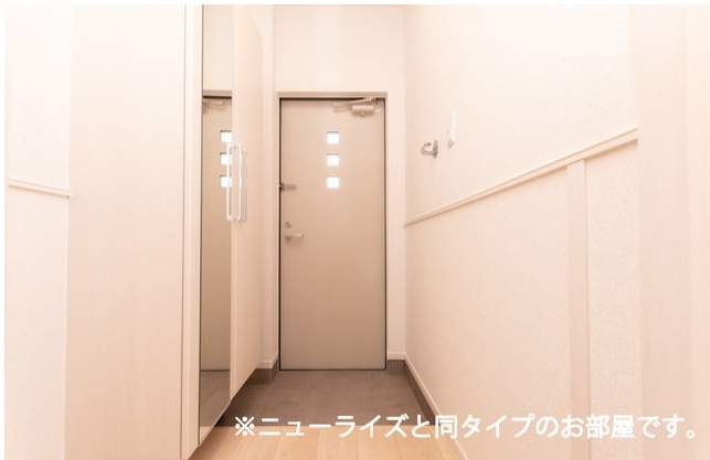
※ニューライズと同タイプのお部屋です。