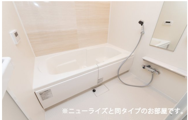
※ニューライズと同タイプのお部屋です。