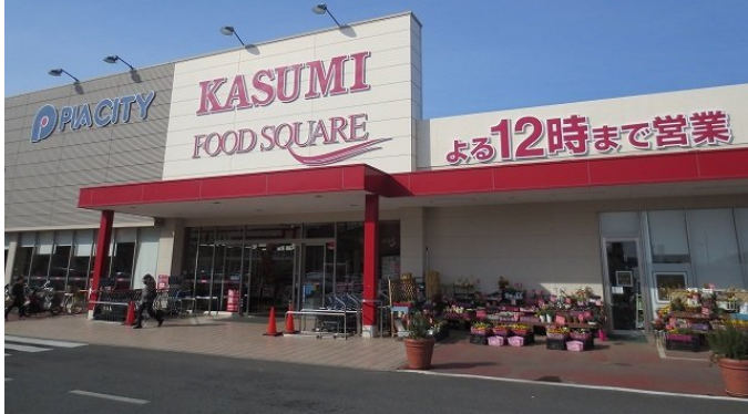
カスミストアーまで 1800M