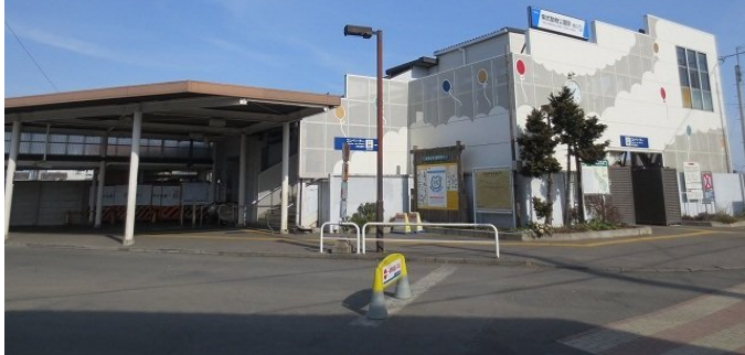
東武動物公園駅まで 700M