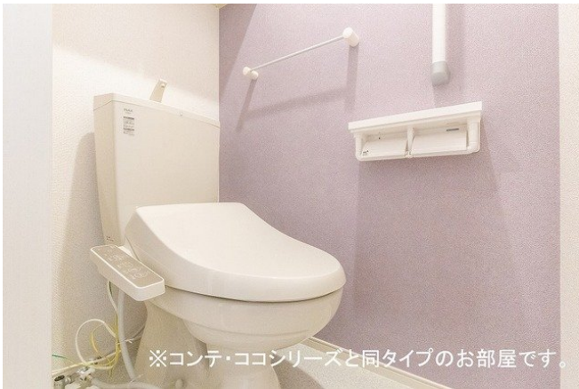
※コンテ・ココシリーズと同タイプのお部屋です。