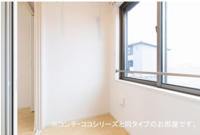
※コンテ・ココシリーズと同タイプのお部屋です。