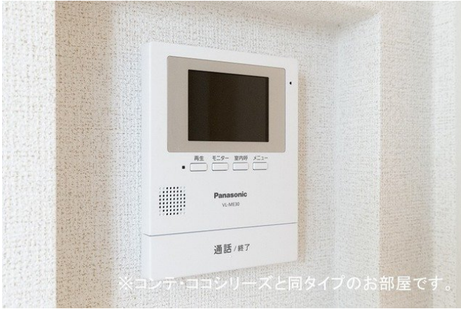
※コンテ・ココシリーズと同タイプのお部屋です。