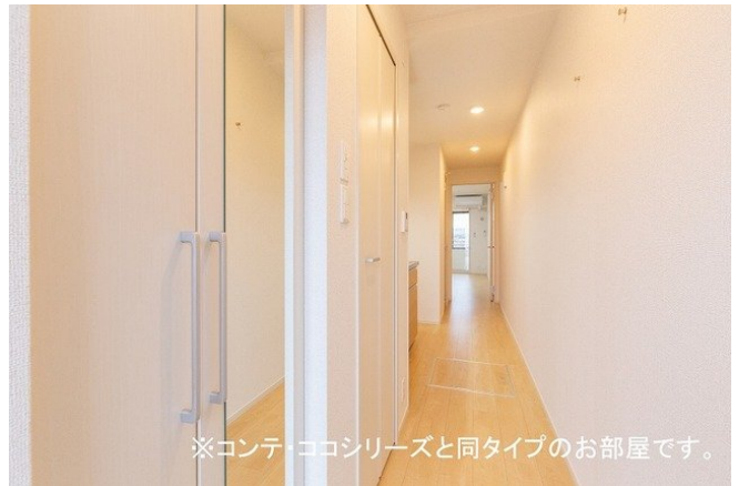
※コンテ・ココシリーズと同タイプのお部屋です。