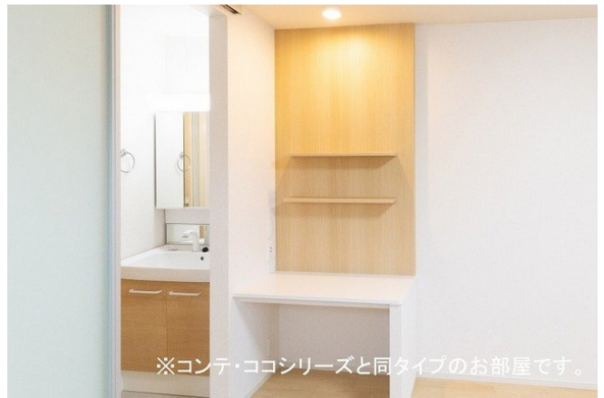
※コンテ・ココシリーズと同タイプのお部屋です。