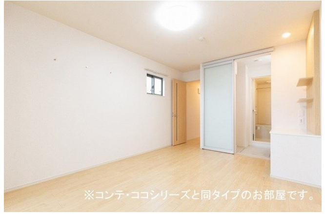
※コンテ・ココシリーズと同タイプのお部屋です。