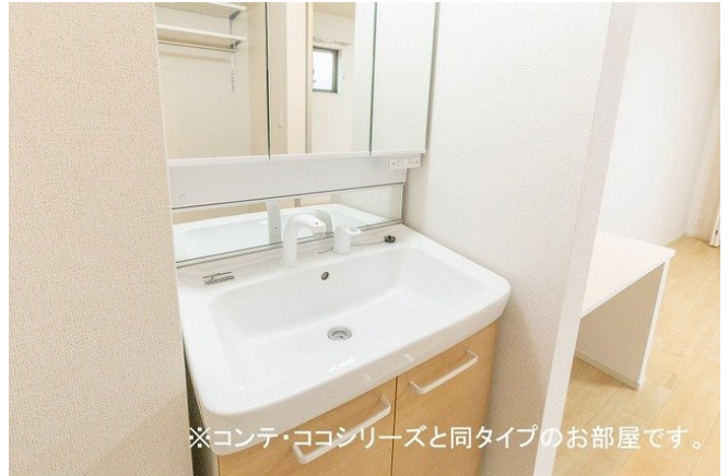
※コンテ・ココシリーズと同タイプのお部屋です。