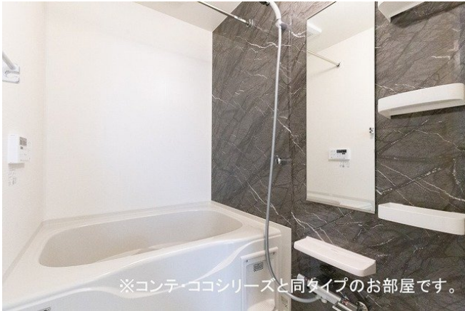
※コンテ・ココシリーズと同タイプのお部屋です。