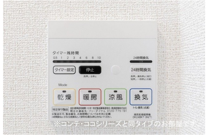
※コンテ・ココシリーズと同タイプのお部屋です。