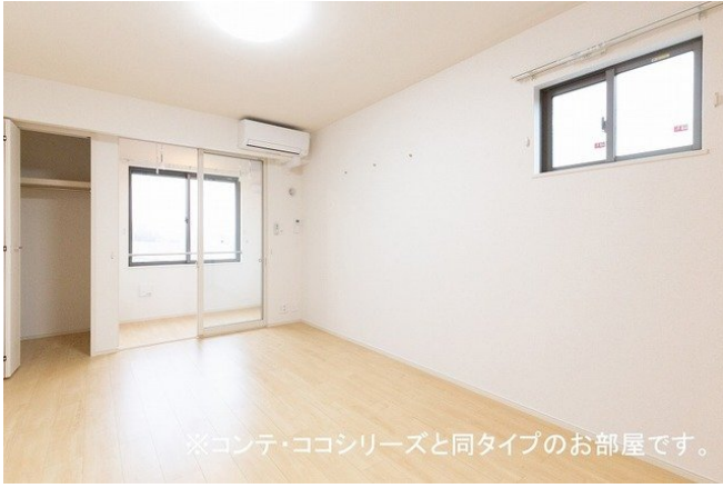
※コンテ・ココシリーズと同タイプのお部屋です。