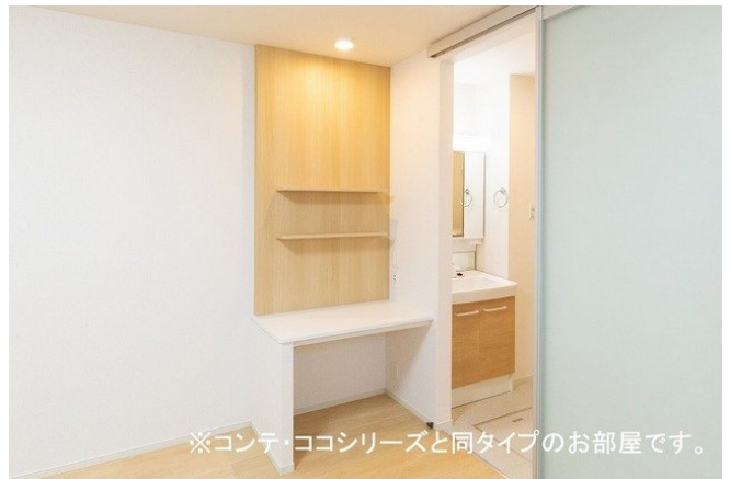
※コンテ・ココシリーズと同タイプのお部屋です。