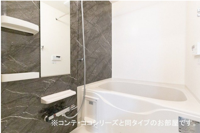
※コンテ・ココシリーズと同タイプのお部屋です。