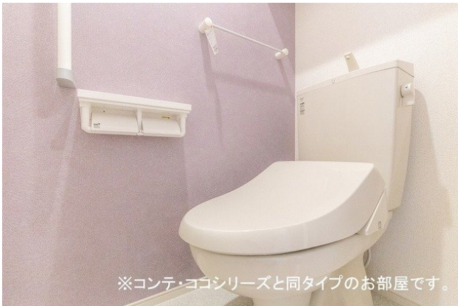
※コンテ・ココシリーズと同タイプのお部屋です。