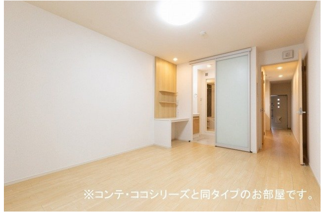
※コンテ・ココシリーズと同タイプのお部屋です。