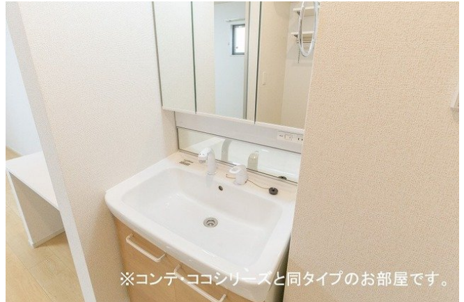
※コンテ・ココシリーズと同タイプのお部屋です。