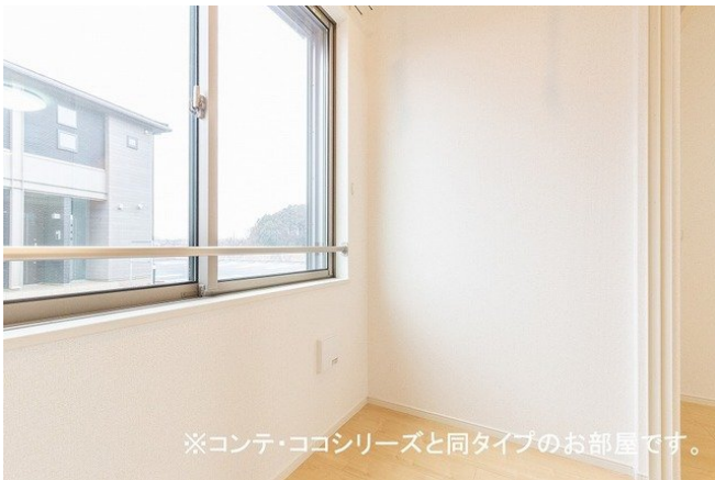
※コンテ・ココシリーズと同タイプのお部屋です。