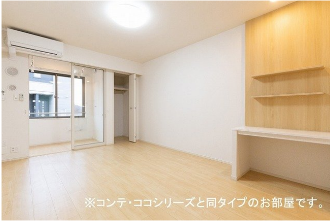
※コンテ・ココシリーズと同タイプのお部屋です。