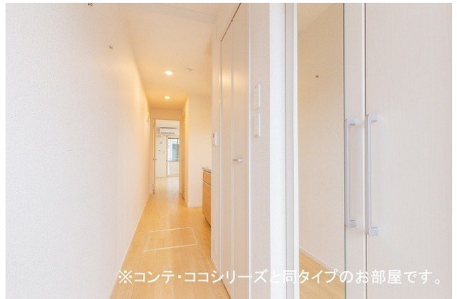
※コンテ・ココシリーズと同タイプのお部屋です。