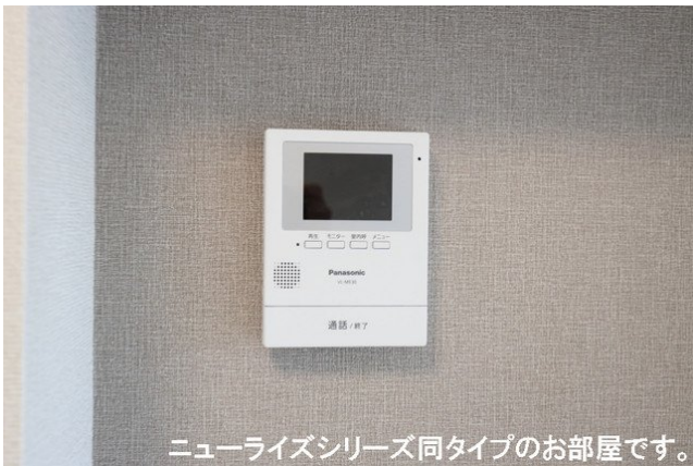
ニューライズシリーズ同タイプのお部屋です。