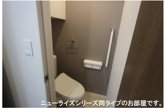
ニューライズシリーズ同タイプのお部屋です。