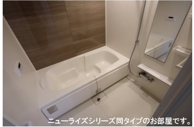
ニューライズシリーズ同タイプのお部屋です。