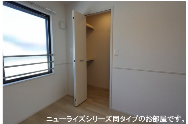
ニューライズシリーズ同タイプのお部屋です。