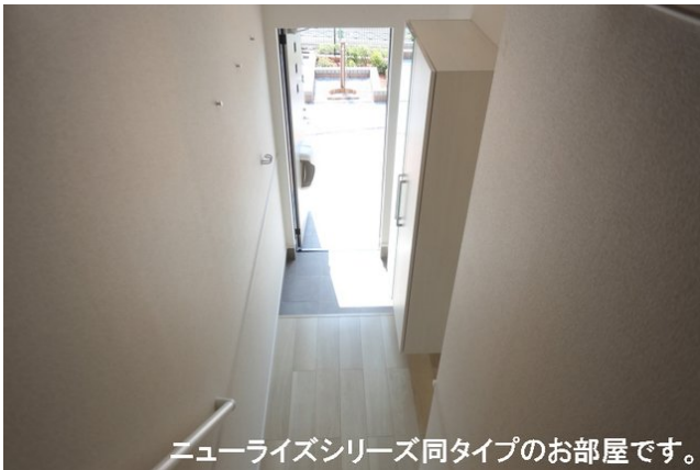
ニューライズシリーズ同タイプのお部屋です。