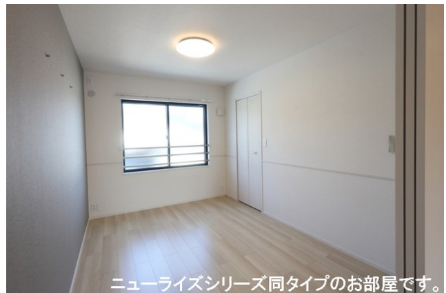
ニューライズシリーズ同タイプのお部屋です。