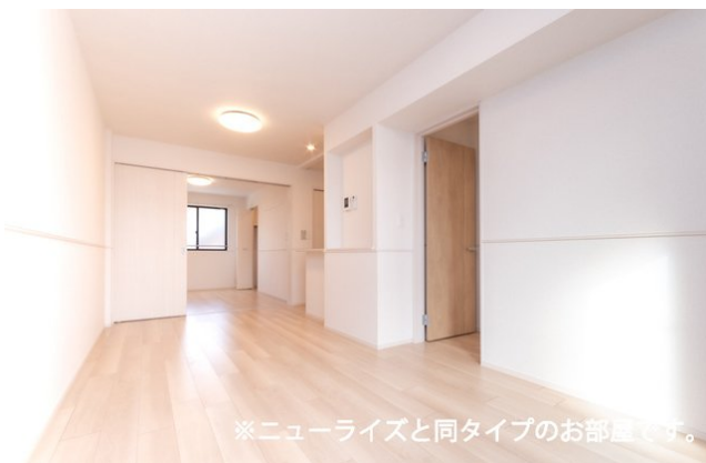
※ニューライズと同タイプのお部屋です。