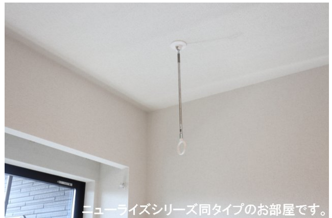
ニューライズシリーズ同タイプのお部屋です。