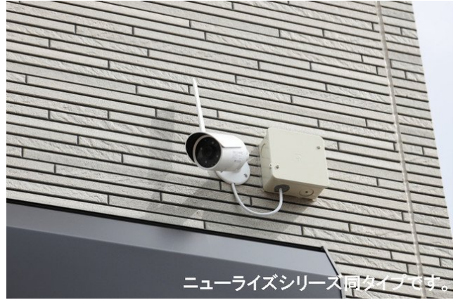
ニューライズシリーズ同タイプです。