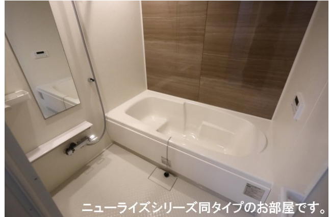
ニューライズシリーズ同タイプのお部屋です。