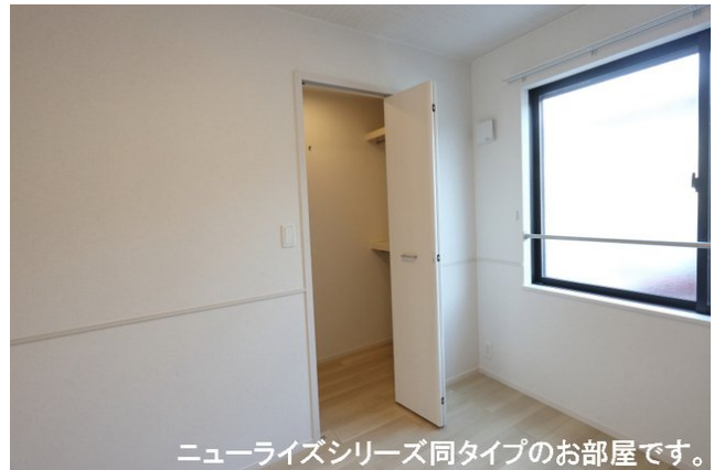
ニューライズシリーズ同タイプのお部屋です。