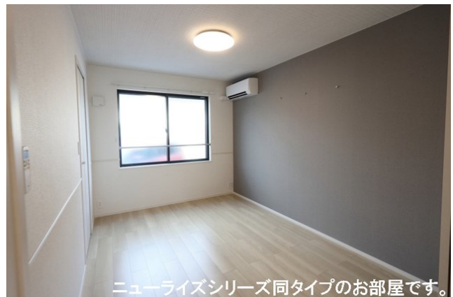
ニューライズシリーズ同タイプのお部屋です。