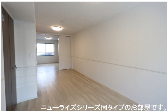
ニューライズシリーズ同タイプのお部屋です。