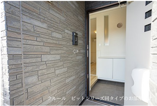
クール ビットシリーズ同タイプのお部屋です。