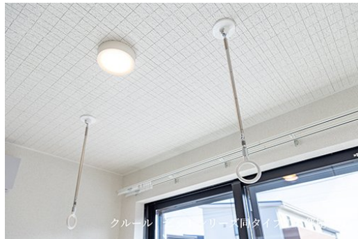
クール ビットシリーズ同タイプのお部屋です。