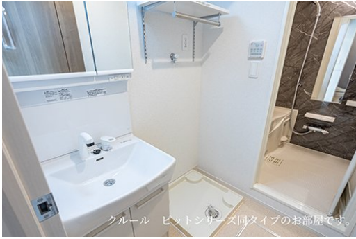
クール ビットシリーズ同タイプのお部屋です。