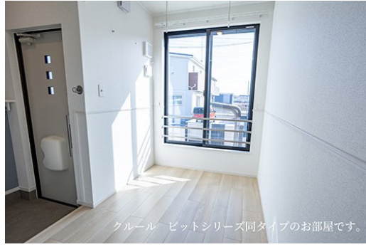
クール ビットシリーズ同タイプのお部屋です。