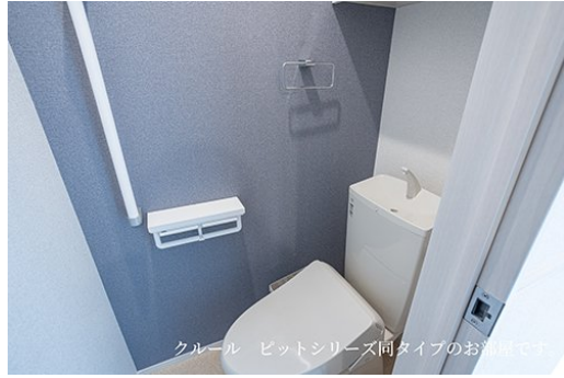
クール ビットシリーズ同タイプのお部屋です。