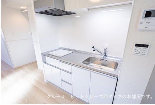
クール ビットシリーズ同タイプのお部屋です。