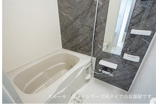
クール ビットシリーズ同タイプのお部屋です。