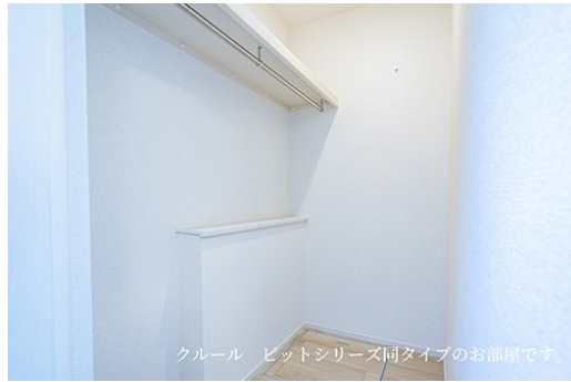
クール ビットシリーズ同タイプのお部屋です。