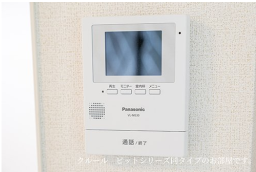
クール ビットシリーズ同タイプのお部屋です。