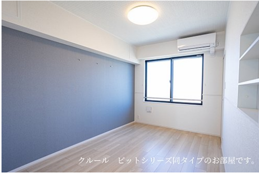
クール ビットシリーズ同タイプのお部屋です。